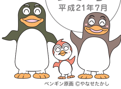
ペンギン原画 ©やなせたかし