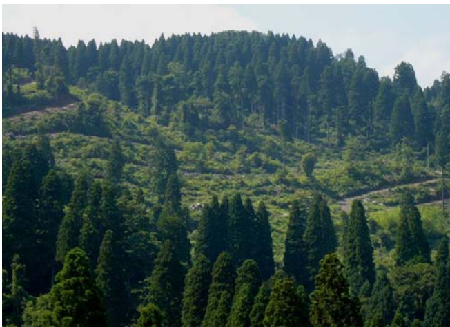
台風の被害にあった森林も伐採・整理から2年が経過し、スギと広葉樹の混ざりあったみどり豊かな森に再生しつつあります。 （高岡市福岡町上野 地内）