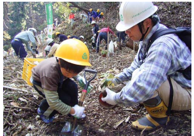
「みどりの里親の集い」では、参加者らは大きく育つように願いを込め、丁寧に作業をしていました。