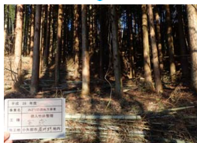
スギ人工林に拡大・侵入した竹林を整理