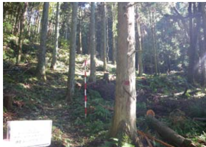
手入れが行き届かず、過密になった人工林を整理