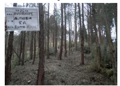
スギ人工林に拡大・侵入した竹林を整理