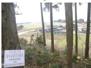
台風や積雪による被害を受けた人工林を整理