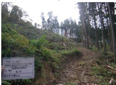
台風や積雪による被害を受けた人工林を整理