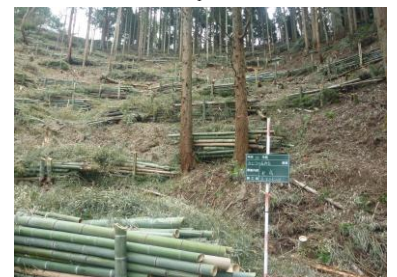
スギ人工林に拡大・侵入した竹林を整理