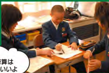
割り算の筆算はこうするといいよ 算数の授業での「学び合い」