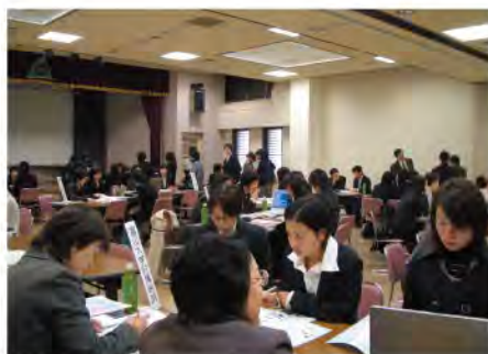
県外看護学生対象の就職説明会

県では、看護師を希望する人や興味を持つ人のために、高校生の一日看護見学の実施や看護師養成機関の共同PRガイドブックの配付を行っています。また、県外看護学生のUターン促進のため、県内病院の特徴や研修体制、処遇等を紹介した就職ガイドブックを配付しているほか、病院就職説明会、希望する病院の見学会、若手看護職員との交流会を実施しています。