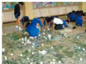
制作風景(砺波市立砺波北部小学校)

県内の3小学校、2中学校、1高等学校、1特別支援学校が、美術館で実現させたい「展覧会」を自由に企画し、作品を制作しました。学校や地域の個性を活かした、夢があふれる展覧会です。