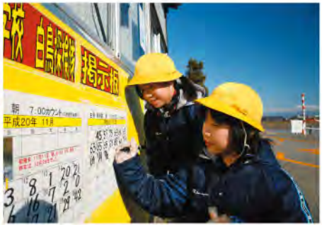
白鳥観察をする池多小学校の児童たち