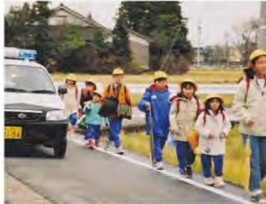
青色回転灯装備車によるパトロール活動