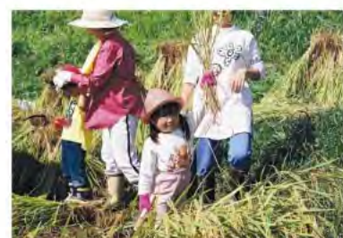
都市と農山漁村の交流の推進