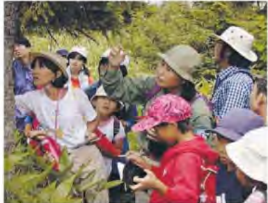
ナチュラルリストの活動