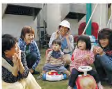
地域子育て支援センター