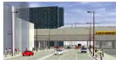
富山駅周辺整備イメージ