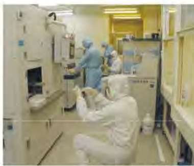
細胞チップの研究風景