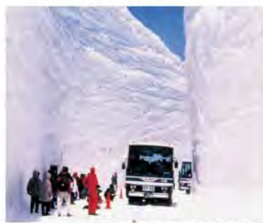
立山黒部アルペンルート(雪の大谷)