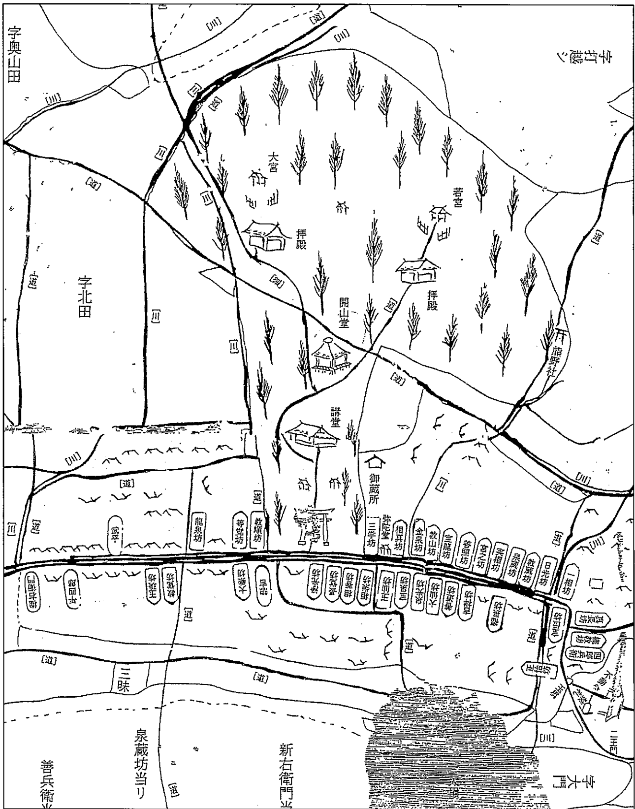
【図③】 芦峯寺衆徒家・社人家・門前百姓家と立山参詣道の位置

本図は『「山宮」に生きる—立山のくらしと民具』（富山県 [立山博物館], 2003年）所収の「芦峯寺高割山絵図」（個人蔵）トレース図から一部をトリミングしてそのまま転載したものである。屋根のみを線で描いている家屋が門前百姓家を示す。