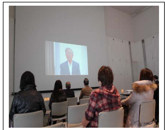
イタイイタイ病映像展 会場の様子

再び悲惨な公害を引き起こしてはならないこと、現在の美しい環境が多くの関係者の努力によって成し遂げられたものであることを改めて確認していただく機会となりました。