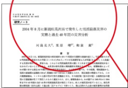
2009 年 8 月に新潟県荒沢岳で発生した雪渓崩落災害の実態と過去 40 年間の災害分析 (日本雪氷学会誌「雪氷」71 巻 6 号)