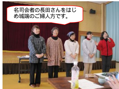
【ごちそうさまでした m(_ _)m】