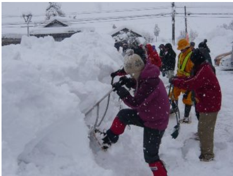
【スノーダンプはこうやって…】