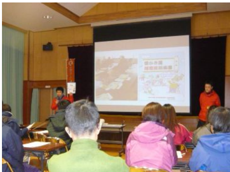
【注意事項などのお勉強】