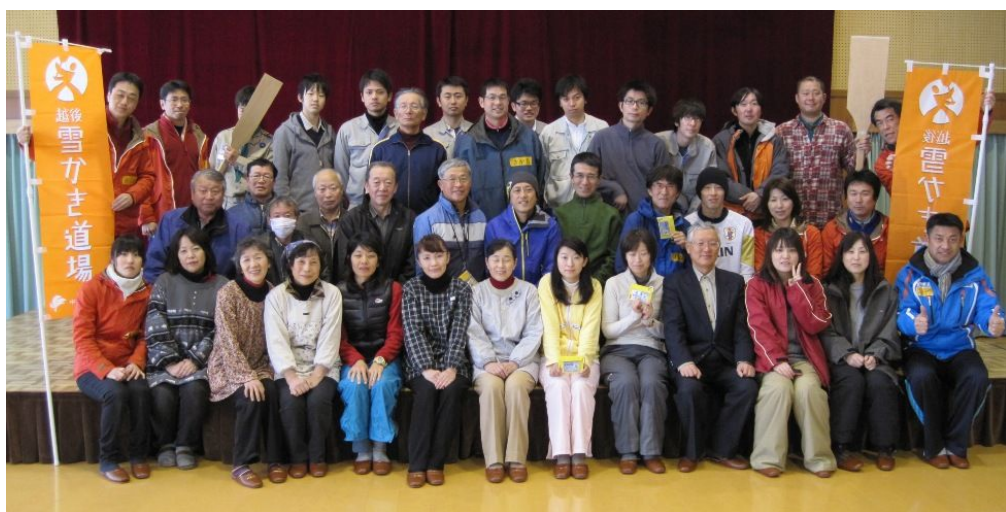
【みなさん、おつかれさまでした】

NPO 中越防災フロンティアさんのHPもご覧下さい。URL http://dojo.snow-rescue.net/ 南砺市役所のHPにも掲載されました。