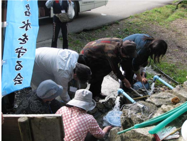
↑「ガット出の水」（富山市八尾町）清掃の様子