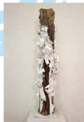
竹内耕祐「消費」2012年 優秀賞