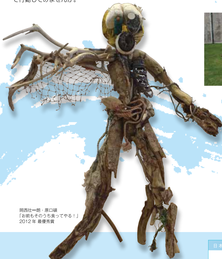
岡西壮一朗・原口碩 「お前もそのうち食ってやる！」 2012年 最優秀賞