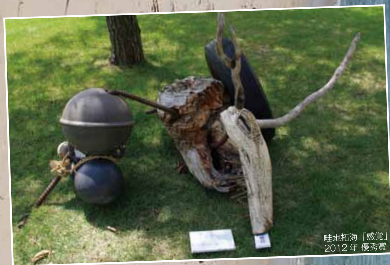
畦地拓海「感覚」 2012年 優秀賞