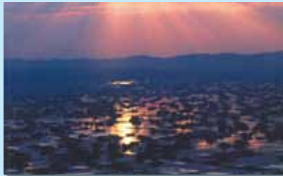
夕日に映える散居村