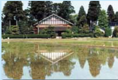
水面に映るアズマダチ