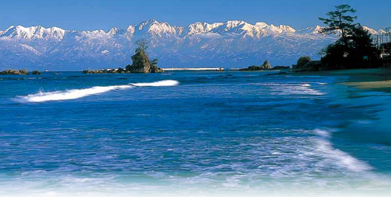
雨晴海岸から見た立山連峰