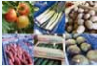
毎月第3火曜日 発送予定

自然豊かな富山県の旬の野菜を詰め合せたセット。毎回6～8品の野菜・果物をお届けします。