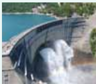
※運行は、11/30までの予定で、乗車予約は不要です。優待券を立山駅きっぷうりばでご提出ください。

3,000mの名峰が連なる北アルプスを横断し、四季折々の大自然や黒部ダムの大放水などを体感してください。