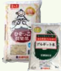
コシヒカリ 5kg アルギット米 5kg

北アルプスの清らかな水で育てたコシヒカリと、味と栄養を高めるために天然海藻を土に混ぜて作ったアルギット米です。