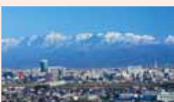
※宿泊は予約が必要です。