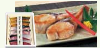
塩ぶり・西京漬け・粕漬け各2切