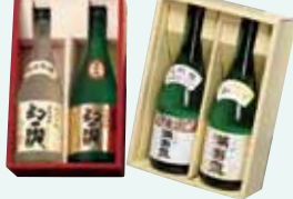
幻の瀧720ml×2本、満寿泉720ml×2本