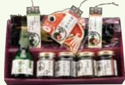
風の盆180ml、いが黒作り等8種