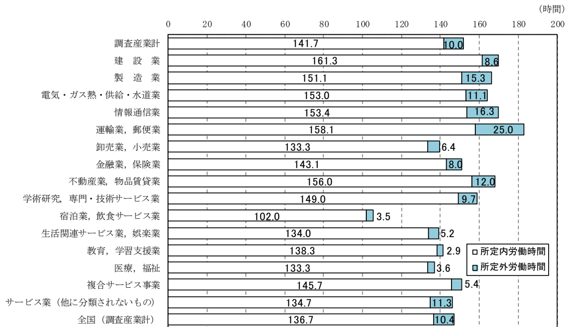
図4 産業別総実労働時間 —規模5人以上—