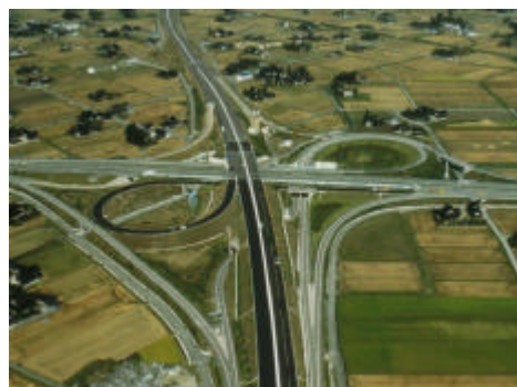
3つの高速道路がつながる 小矢部砺波ジャンクション