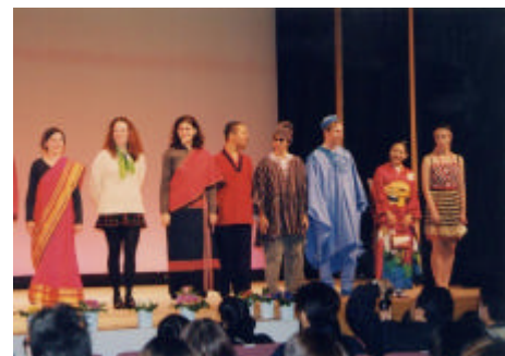
J E Tまつり2000