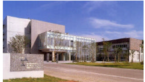
高岡オフィスパークの中核施設、サンセンター（産業高度化センター、総合デザインセンター）