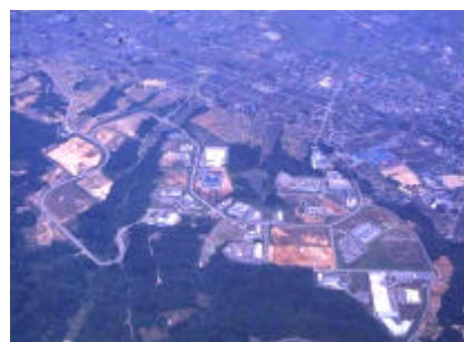
富山八尾中核工業団地