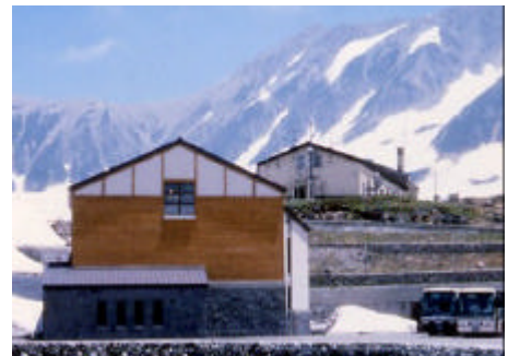
立山自然保護センター