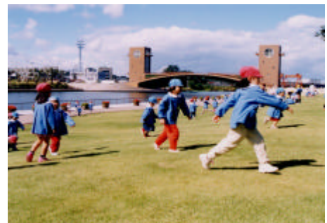
富岩運河環水公園