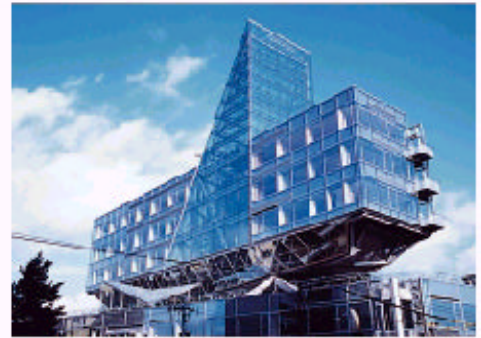
富山県総合福祉会館「サンシップ」とやま