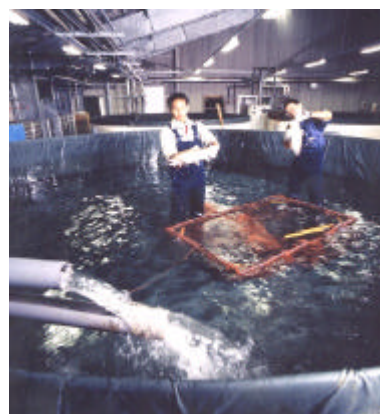
深層水を活用したサクラマスの研究