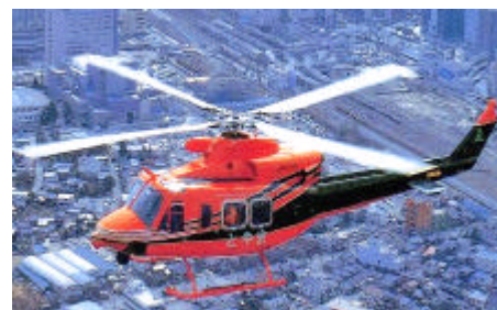
消防防災ヘリコプター