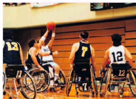
きらりんぴっく富山