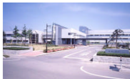
県工業技術センター中央研究所