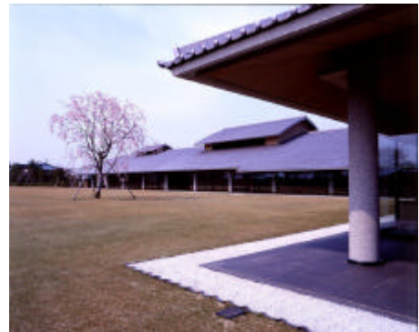
富山県水墨美術館