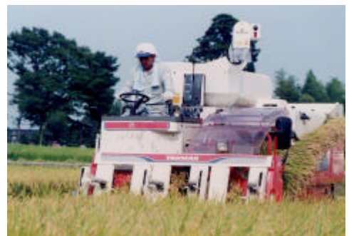
おいしい富山米の収穫