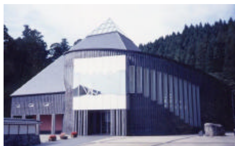
富山県立山博物館