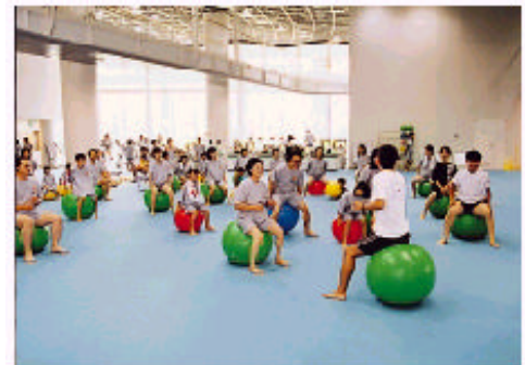
富山県国際健康プラザ