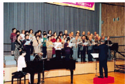
いきいき長寿大学