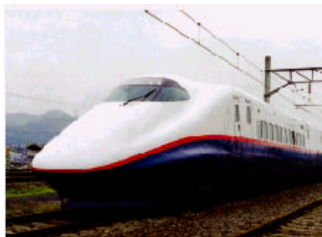
北陸新幹線「あさま」(東京～長野)