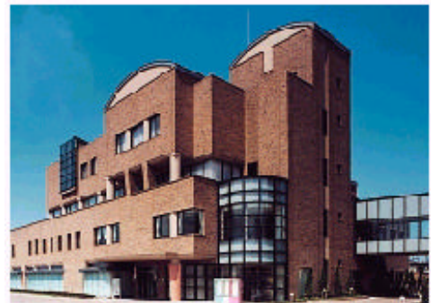
富山県民共生センター