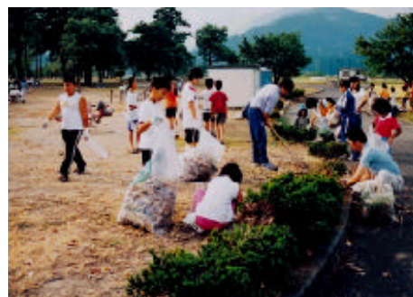
小学生によるボランティア活動