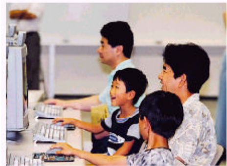
パソコンに親しむ子どもたち