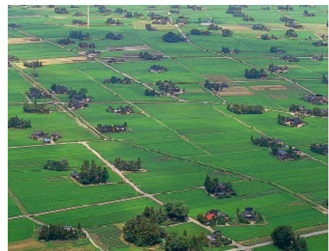
美しい田園風景、砺波の散居村