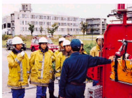
社会に学ぶ「14歳の挑戦」事業