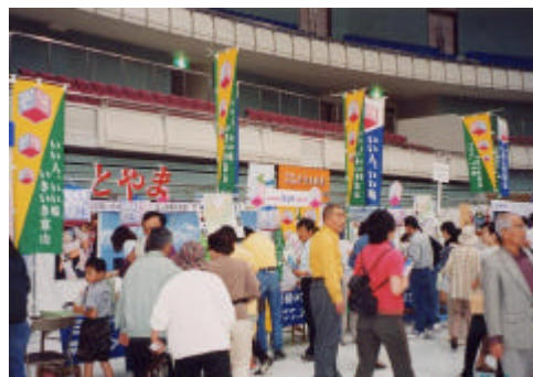
いきいき富山観光キャンペーン