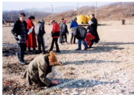
環日本海諸国が協力した海岸漂着物調査