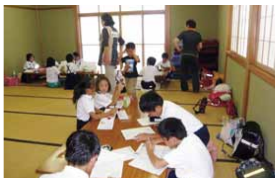
とやまっ子さんさん広場 (子どもの居場所づくり活動)

ふるさとに誇りと愛着を持ち、世界で活躍するチャレンジ精神を持った若者が育っています。