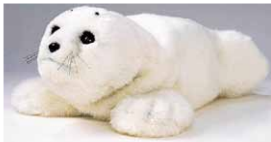
癒しロボット「パロ」

幅広い世代の人が農林水産業に従事し、富山県産の良質で安全な農作物や肉、魚などを、多くの県民がたくさん食べています。