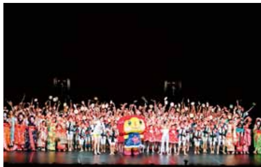
とやま世界こども舞台芸術祭2012