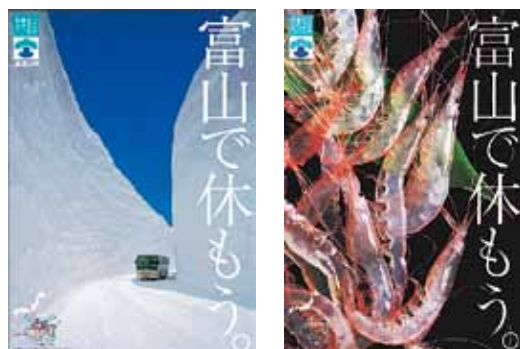
観光ポスター「富山で休もう。」

自然、食べ物、歴史・文化など富山県の魅力が広く知られ、国内外から多くの観光客が訪れています。