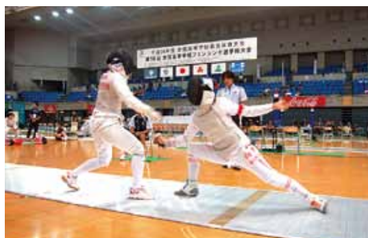
2012北信越かがやき総体