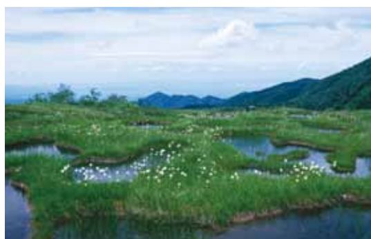
ラムサール条約湿地に登録された立山弥陀ヶ原

廃棄物の発生抑制や再利用など、エコライフの実践が進み、小水力発電(※)など、再生可能エネルギーが活用されています。