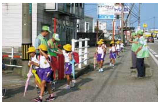
児童の見守り活動

鉄道、路面電車、バスなどが利用しやすく、お年寄りや障害のある方にもやさしいまちになっています。