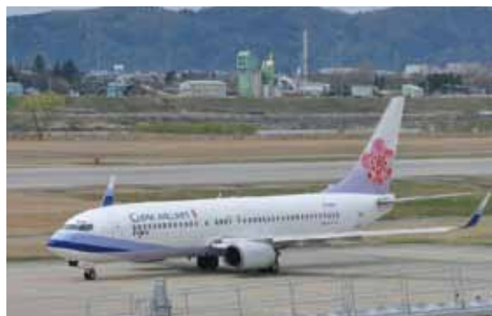
富山空港 (富山-台北便)

港や道路網が整備されていて、富山県が、環日本海地域の物流、経済交流、海外ビジネス展開の拠点となっています。