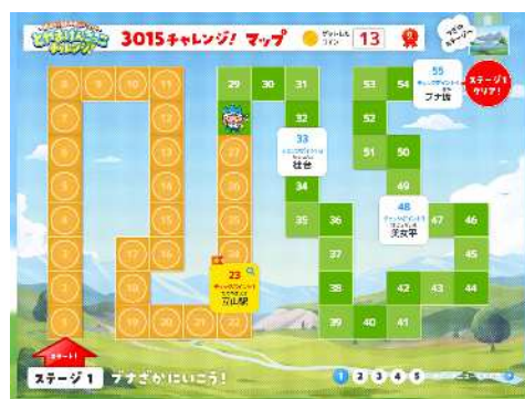
チャレンジマップ画面