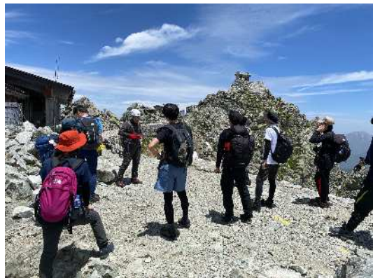
集団登山引率者講習会の様子（R5）