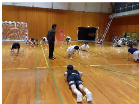
呉羽中学校・ハンドボール部