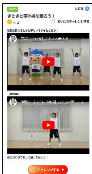
動画を活用したミッション画面

ウ R5実績 ・利用者数 小学生：37,892人 中学生：19,173人 ・キャンペーン応募数 10,571口（2回実施） ・Youtubeチャンネル登録者数1,157人 視聴回数26,4万回（R5）