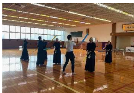
剣道授業指導法講習