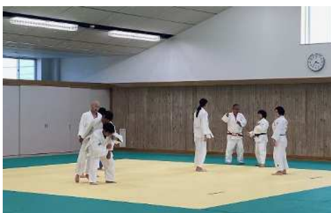
武道資格認定講習会