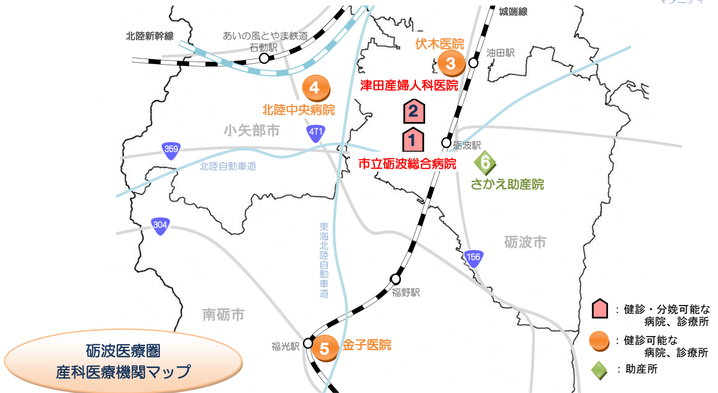
砺波医療圏 産科医療機関マップ

砺波医療圏では、分娩が可能な医療機関と健診が可能な医療機関が相互に連携し、妊婦さんが安心して安全に妊娠出産を迎えていただけるように努めています。