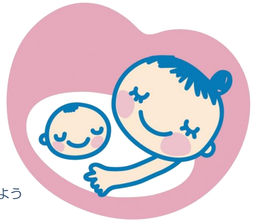
「健やか親子21」 マタニティマーク

全国的に分娩を取り扱う医療機関が減少しています。その結果、妊婦健診が特定の医療機関へ集中してしまい、健診の待ち時間が長くなったり、緊急に診察が必要な妊婦さんへの対応が困難になっていたりしています。