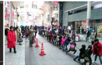
地域体験イベント