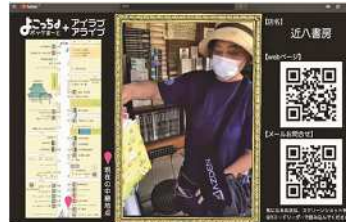
WEBを活用したハイブリットイベント