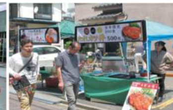
まちバル・グルメイベント