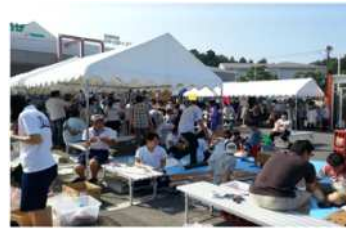
復興イベント・祭り