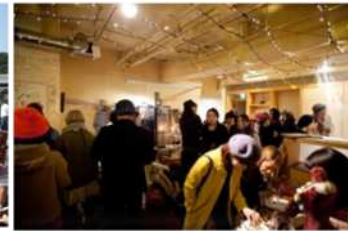
チャレンジショップ