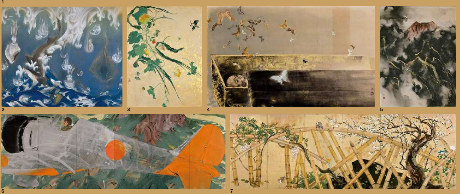
表 = 《草の美》(部分) 1931(昭和6)年 裏 = 1 《草の実》1931(昭和6)年 2 《龍巻》1933(昭和8)年 ※後期展示予定 3 《爆弾散華》1945(昭和20)年 4 《夢》1951(昭和26)年 5 《怒る富士》1944(昭和19)年 6 《香炉峰》1939(昭和14)年 ※前期展示予定 7 《龍子垣》1961(昭和36)年 ※後期展示予定 ※全て、大田区立龍子記念館蔵

関連行事 ■ 講演会「日本画家・川端龍子の会場芸術」 4月13日(土)午後2時から 講師 = 木村拓也氏(大田区立龍子記念館学芸員) 会場 = 映像ホール 定員 = 50名(先着順 開場午後1時30分) ※申し込み不要 ※聴講無料 ※満席になり次第、入場を制限させていただく場合があります。