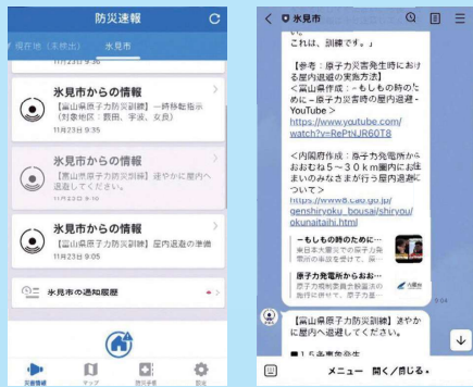
Yahoo! 防災速報アプリ 氷見市公式LINE