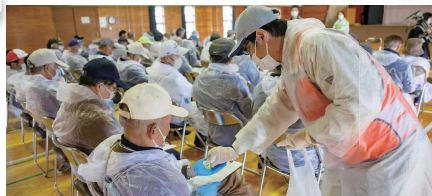
薬剤師による説明・配布