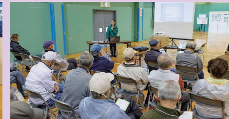
防災士会による講演会