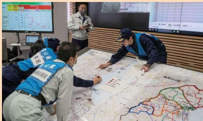
情報を集約し対応する図上訓練

防災危機管理センターにおいて、映像情報システム等の設備を活用した図上訓練を実施しました。道路の通行止めや避難所の被災等を想定し、関係機関と協議の上、避難ルートの方針決定などを行いました。