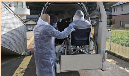
入所者等の一時移転訓練

特別養護老人ホームつまま園、特別養護老人ホーム氷見苑、介護老人保健施設エルダーヴィラ氷見において、屋内退避訓練を実施しました。氷見苑では、特別養護老人ホーム雨晴苑に一時移転する訓練も行いました。