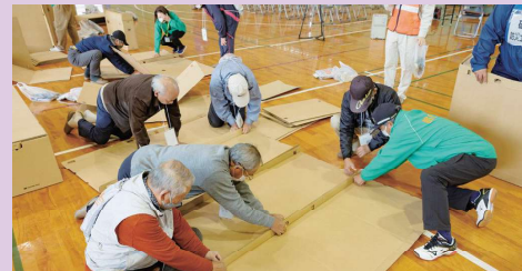
段ボールベッドやパーテーションの組立て