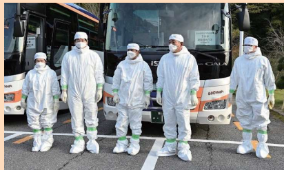
防護服を着用してのバス輸送支援

県バス協会および県タクシー協会との災害時応援協定に基づき、住民や社会福祉施設の入所者等の輸送を支援いただきました。防護服や個人線量計の受け渡し・着用の訓練も実施しました。