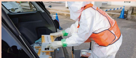
安定ヨウ素剤の搬出