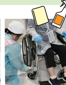
汚染箇所の拭取除染