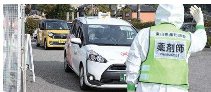
ドライブスルー方式による配布