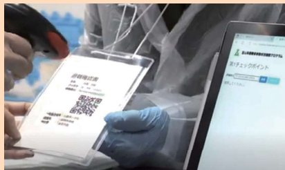
避難者移動状況確認プログラム

「避難者移動状況確認プログラム」を活用し、避難地域時検査場所や避難所において個人情報登録した二次元コードを読み取ることにより、住民の皆さんの避難状況を瞬時に関係機関で共有しました。