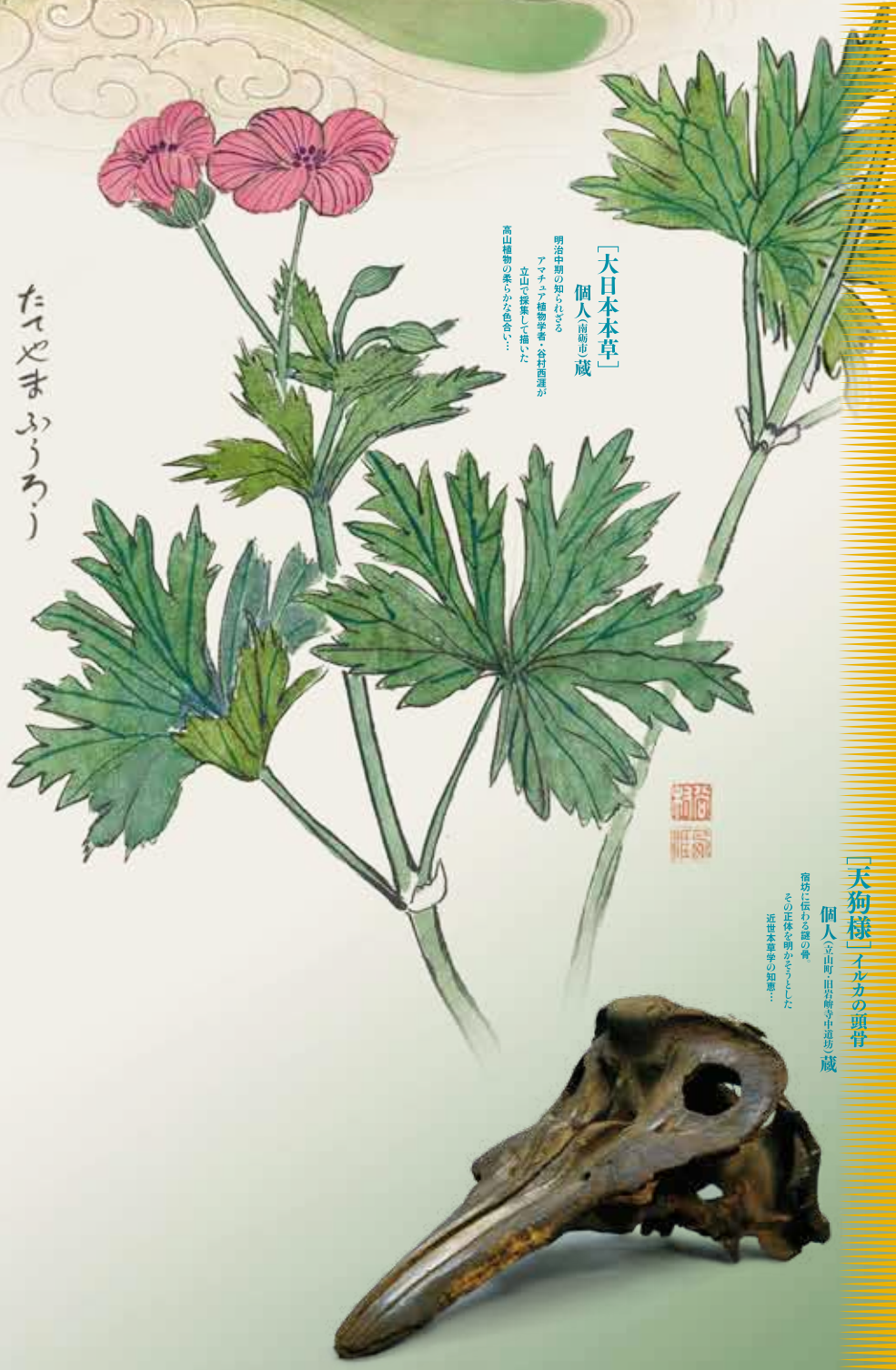
「大日本本草」 個人（南無也）蔵