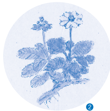
石崎光瑤が立山で採った チョウノスケソウの図