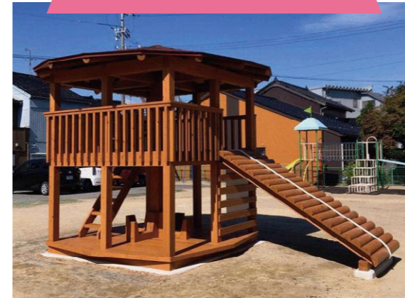
園庭など屋外に設置する遊具です。地面に固定するため、動きません。屋外用自然塗料を使用し外部環境から木を守ります。