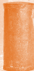
③日中経塚出土銅経筒