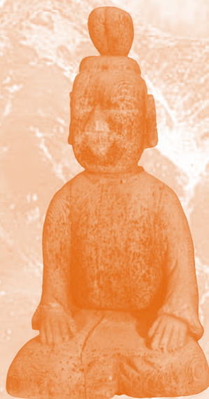
④立蔵社神像