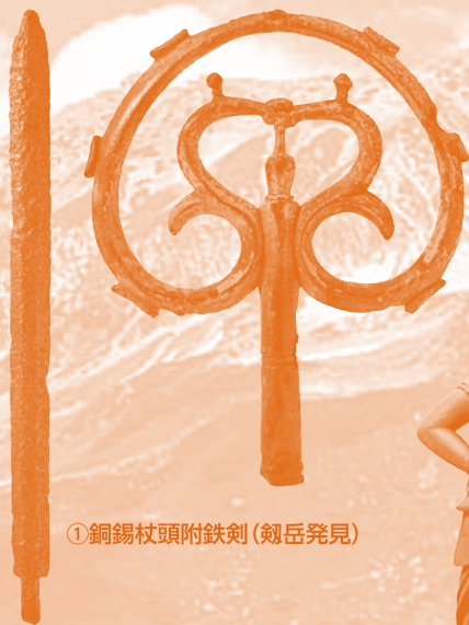
①銅錫杖頭附鉄剣(剣岳発見)