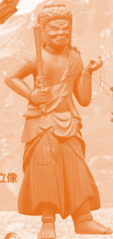
⑤木造不動明王立像