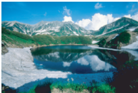
(立山室堂 みくりが池)