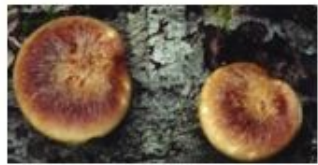
傘は通常半円形または扇 型であるが、 円形のもの も報告されている(上)。

黒いシミがあるものが多い。黒いシミがほとんどないものもあるので注意が必要である。