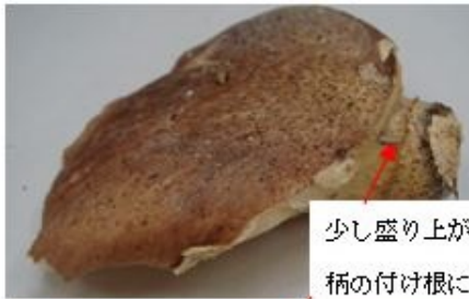
少し盛り上がったつばが 柄の付け根にある