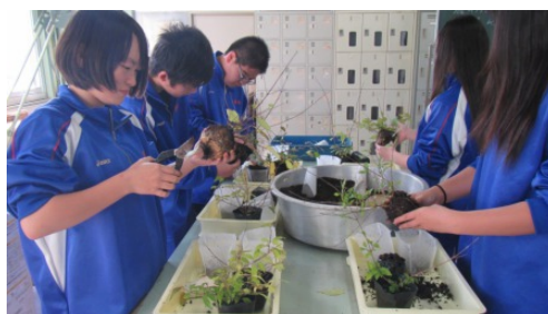
（上市高校）作業の様子②