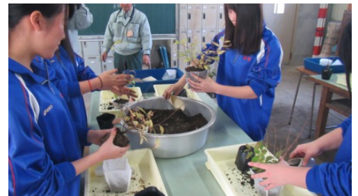
（上市高校）作業の様子①