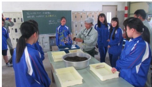
（上市高校）県農林水産総合技術センター職員による指導

※「生分解性ポット」は、土中のバクテリアにより分解されるバイオマス素材で作られており、そのまま植樹することができます。廃棄物の削減にも繋がるため、「第68回全国植樹祭」では、このポットを使用することとしています。