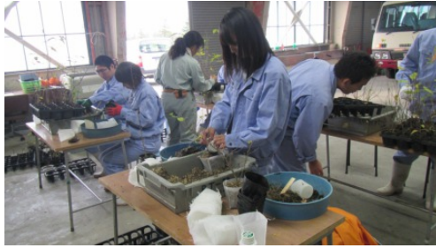
(中央農業高校) 作業の様子②