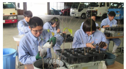
（中央農業高校）作業の様子①