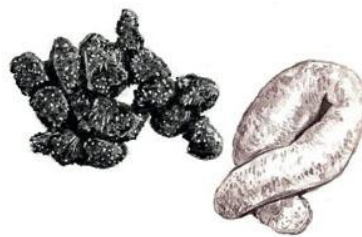
ツキノワグマの糞