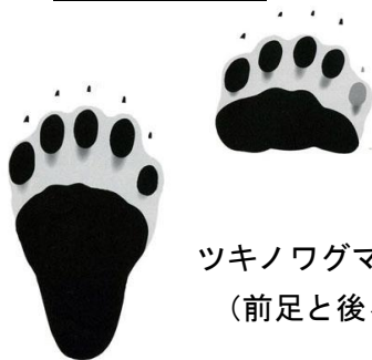
ツキノワグマの足跡 (前足と後ろ足)

・注意していてもクマと近距離で出遭う場合があります。防御策として、 ヘルメットの着用が頭部の被害を軽減 できます。また、 接近してくるクマにはクマ撃退スプレーが効果的 です。山仕事などで頻繁に入山する方は携行することを勧めます。