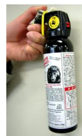
クマ撃退スプレー