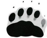
ツキノワグマの足跡 (前足と後ろ足)