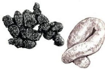
ツキノワグマの糞