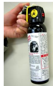
クマ撃退スプレー