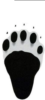
ツキノワグマの足跡 (前足と後ろ足)

・注意していてもクマと近距離で出遭う場合があります。防御策として、 ヘルメットの着用が頭部の被害を軽減 できます。また、 接近してくるクマにはクマ撃退スプレーが効果的 です。山仕事などで頻繁に入山する方は携行することを勧めます。