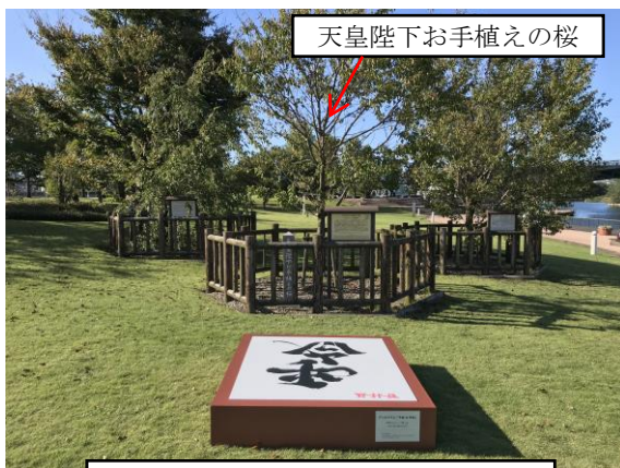
天皇陛下お手植えの桜