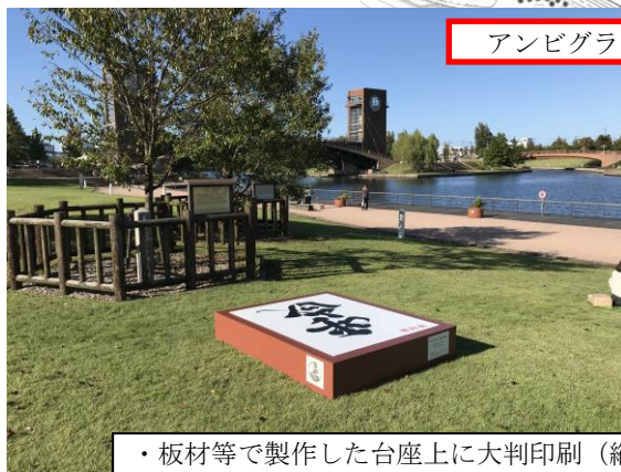
アンビグラム「平成⇄令和」