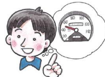
速度を控えて運転する