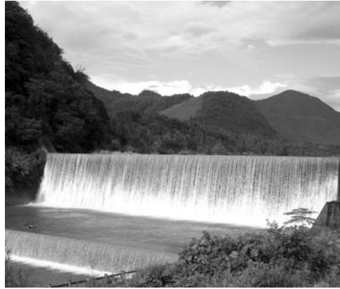
本宮堰堤 (重要文化財)

富山県は、日本イコモス国内委員会によって「日本の20世紀遺産20選」に選定された立山砂防の歴史的砂防施設群の世界遺産登録を、関係機関や民間団体等と連携協力しながら目指しています。 このシンポジウムでは、世界遺産の最前線で活躍する専門家に、世界遺産における20世紀遺産の意義や立山砂防が日本の20世紀遺産20選に選定された意義について講演・パネルディスカッションしていただき、立山砂防のその顕著な普遍的価値を広く世界に発信します。