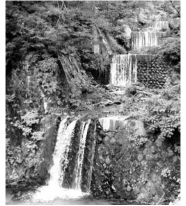
泥谷堰堤 (重要文化財)