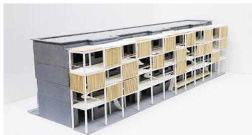
整備後外観イメージ