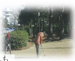
芝生広場では、パークゴルフを楽しむ人も

富山新港を一望できる「富山新港展望台」があります。展望台には、富山新港の歴史や港湾の役割を解説するパネルなどが展示されています。