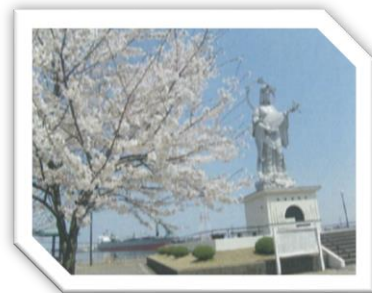
展望台の近くには平和と港の守護の願いを込めて建立された「新湊弁財天」が立っています