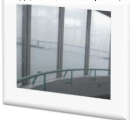
展望台からの眺め 晴れた日には、立山連峰も！