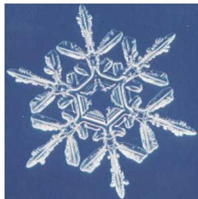
【 雪の結晶 】