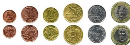
リアル硬貨 ( 左から: 1 centavo、5 centavos、10 centavos、25 centavos、50 centavos、R$1 )