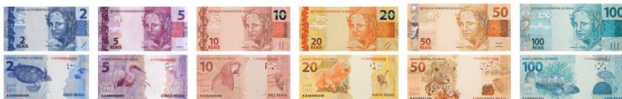
リアル紙幣 ( 左から: R$2、R$5、R$10、R$20、R$50、R$100 ) 裏に国の豊かな動物相を代表する動物が描かれている

R$1以下の単位は「centavo」(センターヴォ、複数センターヴォス)と呼ばれ、リアルの \frac{1}{100} です。(ドルの「セント」に相当)