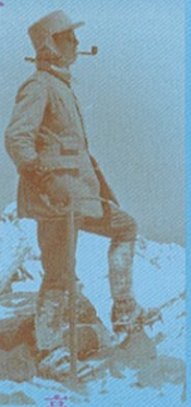
立山雄山頂上の秩父宮殿下