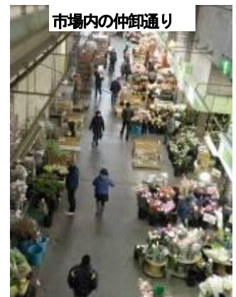
市場内の仲卸通り

このように生産者側から常に販売提案することはたいへん重要です。農林振興センターでは生産者が行う切花販売の市場向けPRや、HP開設による直売手法の検討等、様々な取り組みに対して支援しています。