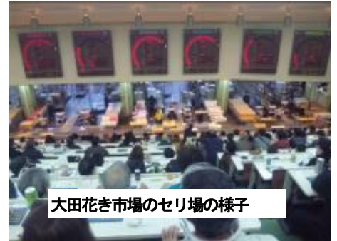
大田花き市場のセリ場の様子

新川管内の黒東チューリップ切花出荷組合では、主に東京都大田市場へ出荷しています。大田市場では、新潟県や埼玉県等の大規模なチューリップ切花産地からも入荷しており、黒東のチューリップを売り込むには、それら産地との差別化が必要となります。