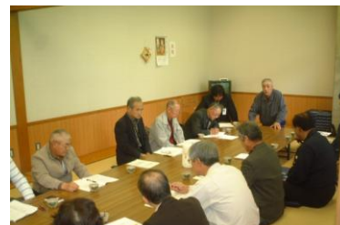
JA うおづねぎ出荷組合設立総会

「JA うおづねぎ出荷組合」を設立し、定期的に栽培講習会や意見交換会を開催して組合員の資質向上に努めています。また、生産・出荷時に協力し合える「連帯意識の強い組織」が形成されようとしています。