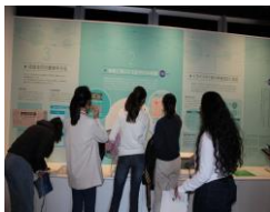
～シンガポール中学生～

当資料館では今後も、世代を問わず海外からの来館者を積極的に受け入れることにより、イタイタイ病の教訓を世界に向けて発信していきます。