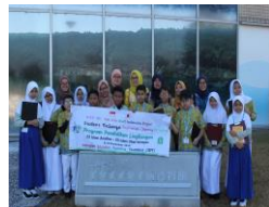
～インドネシア小学生～